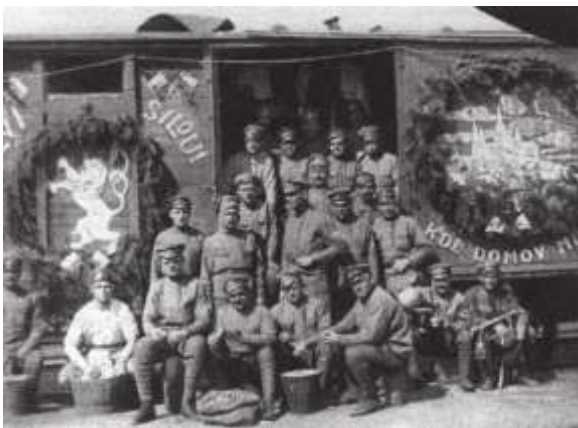
Českoslovenští legionáři v Rusku

Nejosudovější okamžik spojený s legionářskou aktivitou v Rusku však nastal 17. července 1918, kdy se legionáři přiblížili k zauralskému Jekatěrinburgu , kde byli vězněni svržený car Mikuláš s carevnou a dětmi: na přímý Leninův příkaz bolševická stráž odvedla celou carskou rodinu do sklepa a tam ji postříleli (Mikuláš II. byl v 90. letech 20. století svatořečen v pravoslavné církvi).