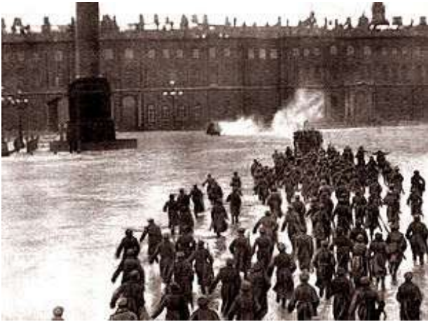
Útok na Zimní palác v ruském hraném filmu z 20. let

První akce nových vládců Ruska byly (především Leninovým přičiněním) dobře promyšlené a následovaly v rychlém sledu. Ještě 7. listopadu bolševici vydali leták Občanům Ruska , který několika větami shrnul výsledek převratu. Zároveň byl zahájen (v petrohradském paláci Smolnyj, jenž sloužil bolševikům jako hlavní stan) Všeruský sjezd sovětů : byl naplánován již dříve a bolševická revoluce záměrně vypukla před jeho začátkem. Úspěšní bolševici ovládli jednání