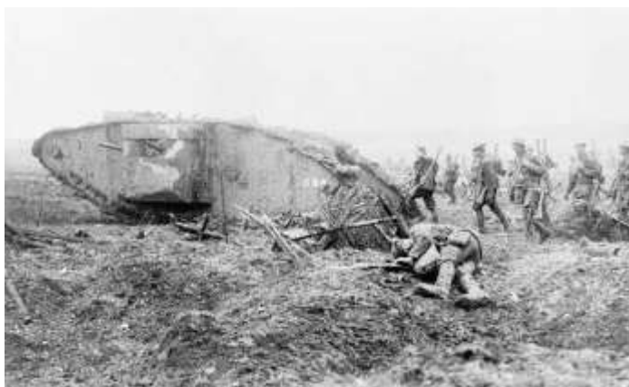
Kanadští vojáci s tankem na frontě

29. září 1918 kapitulovalo – jako první stát Ústředních mocností – Bulharsko .