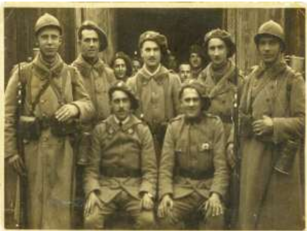
Českoslovenští legionáři ve Francii

V r. 1916 byli Kramář a Rašín odsouzeni k trestu smrti, ale než mohlo dojít k popravě, zemřel 21. listopadu 1916 císař František Josef I. (1830 – 1916) po bezmála 68 letech vlády (stal se jedním z nejdéle vládnoucích monarchů světových dějin) a jeho nástupce a prasynovec Karel I. (1887 – 1922; manželka císařovna Zita 1892 – 1989) vyhlásil amnestii , která propustila na svobodu všechny zatčené politické vězně z r. 1915.