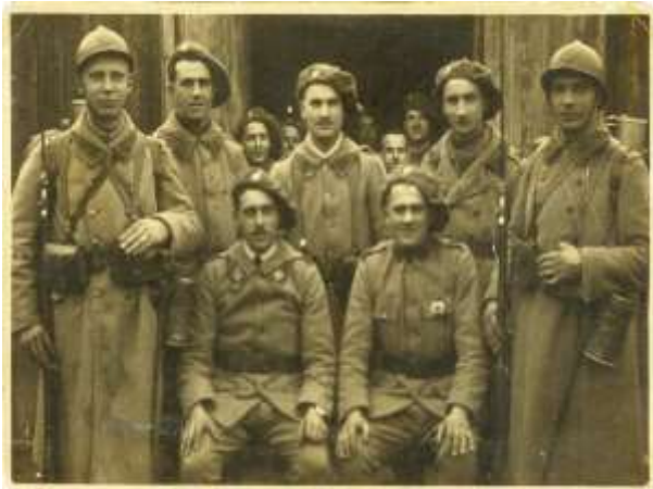
Českoslovenští legionáři ve Francii

V r. 1916 byli Kramář a Rašín odsouzeni k trestu smrti, ale než mohlo dojít k popravě, zemřel 21. listopadu 1916 císař František Josef I. (1830 – 1916) po bezmála 68 letech vlády (stal se jedním z nejdéle vládnoucích monarchů světových dějin) a jeho nástupce a prasnovec Karel I. (1887 – 1922; manželka císařovna Zita 1892 – 1989) vyhlásil amnestii , která propustila na svobodu všechny zatčené politické vězně z r. 1915.