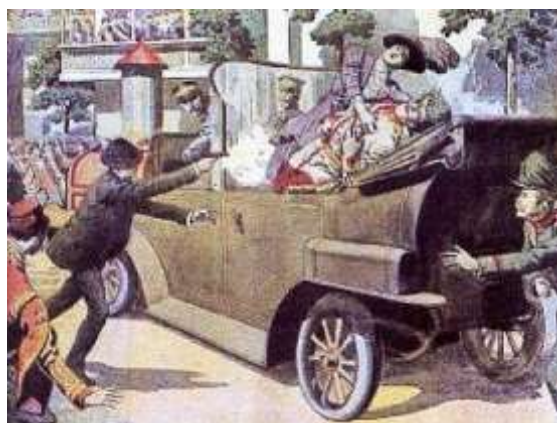
Výstřely, které změnilý svět

Sarajevo je metropolí jihoslovanského regionu Bosna a Hercegovina, kde byla v r. 1878 nadvláda turecká vystřídána rakousko-uherskou (viz VI.G.19.). Na začátku léta 1914 rakousko-uherská armáda demonstrovala u Sarajeva svou sílu provokativními manévry (vojenským cvičením), jichž se zúčastnil i následník trůnu, arcivévoda František Ferdinand d'Este (1863 – 1914) se svou manželkou Žofíí (1868 – 1914). Oba se během slavnostní jízdy autem po sarajevských ulicích stali terčem úspěšného atentátu,