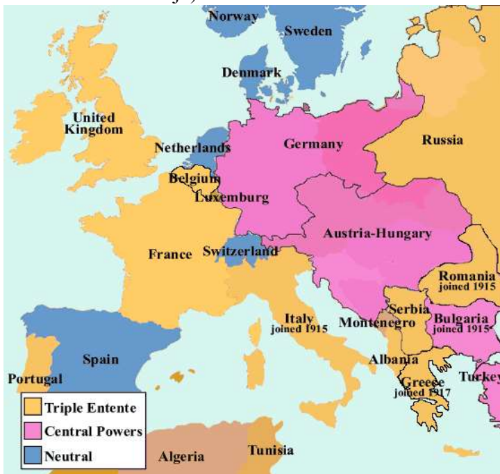
Evropa za První světové války

2. Ústřední mocnosti: státy s prvky či pozůstatky absolutismu , usilující upevnit své autoritativní politické systémy prostřednictvím zisků v novém světovém rozdělení vlivových sfér : Německo, Rakousko-Uhersko, Turecko (Osmanská říše), Bulharsko, německé kolonie Kamerun, Německá východní Afrika (především dnešní Tanzanie), Německá jihozápadní Afrika (dnešní Namibie) a četná německá koloniální území na tichomořských ostrovech (zejména v Mikronésii a v části Nové Guineje).