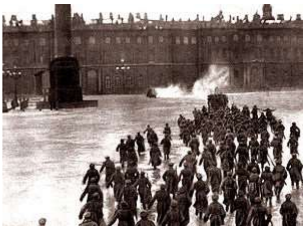
Útok na Zimní palác v ruském hraném filmu z 20. let

První akce nových vládců Ruska byly (především Leninovým přičiněním) dobře promyšlené a následovaly v rychlém sledu. Ještě 7. listopadu bolševici vydali leták Občanům Ruska , který několika větami shrnul výsledek převratu. Zároveň byl zahájen (v petrohradském paláci Smolnyj, jenž sloužil bolševikům jako hlavní stan) Všeruský sjezd sovětů : byl naplánován již dříve a bolševická revoluce záměrně vypukla před jeho začátkem. Úspěšní bolševici ovládli jednání