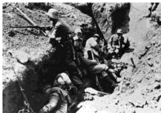
Němečtí vojáci v zákopech ve Francii

Němci zvolili strategii bleskové války (blitzkriegu), již chtěli dosáhnout rychlého vítězství na západě, aby se pak mohli soustředit na zdoluhavější boje na východě. Po přepadu Lucemburska zaútočili 4. srpna 1914 na Belgii , a tak obešli francouzskou obranu na francouzsko-německé hranici. První velký úspěch blitzkriegu představovalo dobytí belgického města Liège (Lutyč) ; při akci se vyznamenal generál Erich Ludendorff (1865 – 1937), který se stal jedním z nejuznávanějších velitelů Ústředních mocností.