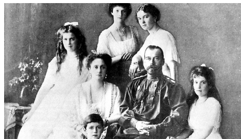
Car Mikuláš s rodinou

5. Car Mikuláš II. nebyl osobnostně pevný člověk. Nechtěným symbolem jeho slabosti se stal vliv, který nad carskou rodinou získal podivínský, ovšem charismatický léčitel a laický kazatel Grigorij Rasputin (1869 – 1916).