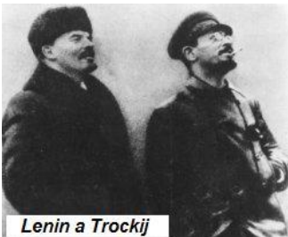
Lenin a Trockij

Leninovými nejbližšími spolupracovníky byli Lev Davidovič Trockij a Josif Vissarionovič Stalin (i jejich příjmení byly pseudonymy). Trockij (1879 – 1940; vlastním jménem Bronštejn) pocházel z rodiny ukrajinského sedláka (židovského původu), pro své politické názory byl vyloučen z vysoké školy a i on zažil nucenou deportaci na Sibiř a následnou emigraci do Spojených států. Stalin (1878 – 1953; vlastním jménem Džugašvili) byl synem gruzínského ševce, studoval na kněze, ale byl vyloučen a přidal se k sociálním demokratům. Také pobýval v západní Evropě a po návratu do Ruska byl v r. 1913 poslán na Sibiř.