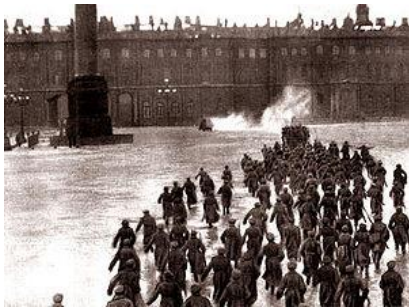
Útok na Zimní palác v ruském hraném filmu z 20. let

První akce nových vládců Ruska byly (především Leninovým přičiněním) dobře promyšlené a následovaly v rychlém sledu. Ještě 7. listopadu bolševici vydali leták Občanům Ruska , který několika větami shrnul výsledek převratu. Zároveň byl zahájen (v petrohradském paláci Smolnyj, jenž sloužil bolševikům jako hlavní stan) Všeruský sjezd sovětů : byl naplánován již dříve a bolševická revoluce záměrně vypukla před jeho začátkem. Úspěšní bolševici ovládli jednání sjezdu podobně, jako předtím získali převahu v petrohradském sovětu. Někteří nebolševičtí delegáti na protest předčasně sjezd opustili. Sjezd pod taktovkou bolševiků pak jednal, jako by byl ruským parlamentem. Již 8. listopadu vydal 3 základní dekrety (výnosy, které měly mít platnost zákona):