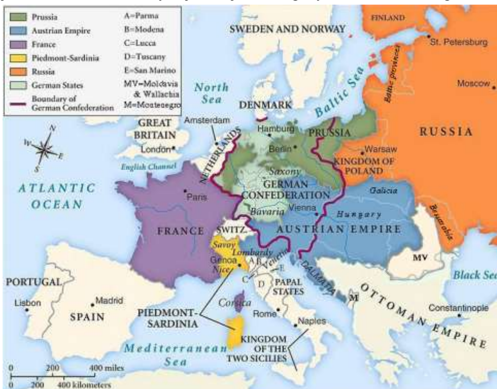
Evropa po r. 1815

Klíčový muž Vídeňského kongresu, rakouský kancléř kníže Klemens von Metternich zůstal ještě dlouhá léta fakticky nejvlivnějším evropským kontinentálním politikem.