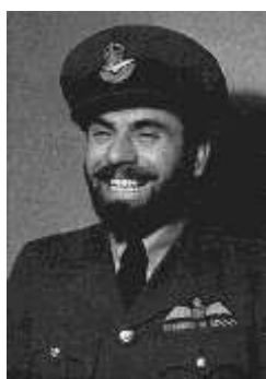
František Fajtl, František Peřina, Josef František

Německá luftwaffe zahájila sérii útoků 13. srpna 1940 a vrhla do boje asi 2 800 letadel různých typů. Proti nim Britové mohli nasadit asi 650 stíhaček. Na britské straně ovšem stál objektivní fakt, že jejich obrana využívala pokročilejší radary než Němci a že britské zbrojovky dokázaly plynuleji než německé nahrazovat zničené stroje. Obě strany nejprve utrpěly těžké ztráty. Vrchní velitel německých leteckých operací maršál Hermann Göring se pak rozhodl zlomit Brity rozsáhlým bombardováním Londýna a okolí. Koncentrace na brutální ničení civilních cílů však ubrala Němcům sílu potřebnou pro letecké souboje a Britové získali ve vzduchu převahu. V britském letectvu (Royal Air Force) se vyznamenali také letci českoslovenští, polští aj. Některé osobnosti z jejich řad se staly velmi proslulými: František Fajtl (1912 – 2006) bojoval v letectvu po celou válku, v r. 1942 byl sestřelen nad Francií, ale dokázal se po dobrodružném putování vrátit do Anglie a znovu se zapojit do bojů, František Peřina (1911 – 2006) při obraně britského vzdušného prostoru v r. 1940 během 3 dnů sestřelil 7 německých bombardérů, a nejúspěšnějším stíhačem celé Bitvy o Británii se stal Josef František (1914 – 1940), který bojoval v řadách polských letců a sestřelil nejméně 17 německých letadel (zahynul při hlídkovém letu).