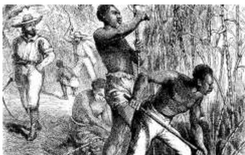
Třtinová plantáž v Karibiku

Požadavek kolonizátorů na pracovní síly v dolech, velkoprodukčním (plantážovém) zemědělství apod. vedl k tomu, že ožil institut otroctví (v průběhu středověku v Evropě již prakticky vymizely; viz V.C.3.). Od éry zámořských objevů Evropané zotročovali domorodce z kolonií. Otroci-dělníci žili i tvrdě pracovali v nelidských podmínkách; otrocké služebnictvo působilo ve fyzicky snesitelnější, ale stále nedůstojné pozici.