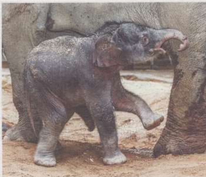
Pátého dubna, krátce po třetí hodině v noci, se v pražské zoo narodilo slůně, sameček vážící 104 kg. Jeho matkou je jedna ze slonice přivezená v roce 2012 ze Srí Lanky. Je to vůbec první mládě slonů, které se v Zoo Praha nejen narodilo, ale i bylo počato.

Zvířata určitě emoce mají. Já bych se ale zase bránil přirovnávat je zjednodušeně k lidem. Na druhou stranu jsem svého času sám o gorilách