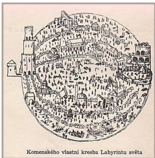
Komenského vlastní kresba Labyrintu světa